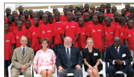
Les délégués du Cégep André-Laurendeau et les partenaires du Centre africain Sport-études (CASE) posent devant les élèves-athlètes

Accueil de dignitaires sénégalais en mission canadienne.