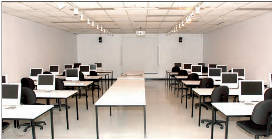
Le nouveau laboratoire d'infographie du programme Arts et Lettres, profil arts visuels

Installation d'un réseau Internet sans fil à la cafétéria.