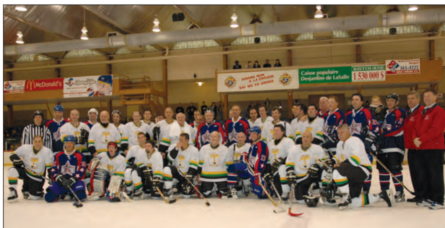
Les joueurs, entraîneurs et arbitres du « Match des Légendes »

Levée de fonds par diverses activités telles un tournoi de golf, une soirée vins et fromages et la sollicitation de divers partenaires qui permet d'offrir un soutien financier à divers projets étudiants et des bourses d'étude.