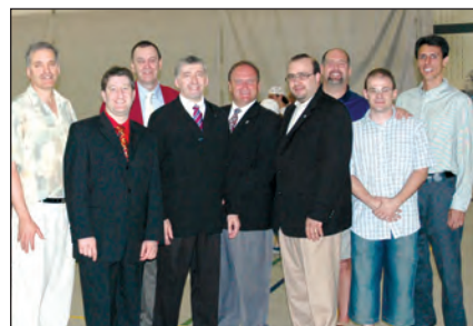
Les partenaires du projet ayant permis aux élèves de l'école du Grand-Héron de bénéficier d'une journée récréative au Centre d'activités physiques.

L' Intercollégial de cinéma étudiant a offert une tribune exceptionnelle aux gagnants de cette année grâce à un partenariat avec le Festival Nouveau Cinéma qui a accepté de présenter les films gagnants dans le cadre de sa programmation.