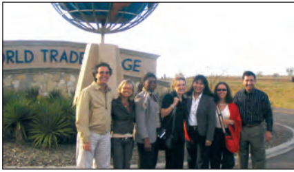
Une équipe du Cégep André-Laurendeau en compagnie des nouveaux partenaires de Nuevo Laredo au Mexique

Protocole d'entente avec l'Université technologique de Nuevo Laredo pour des formations en logistique.